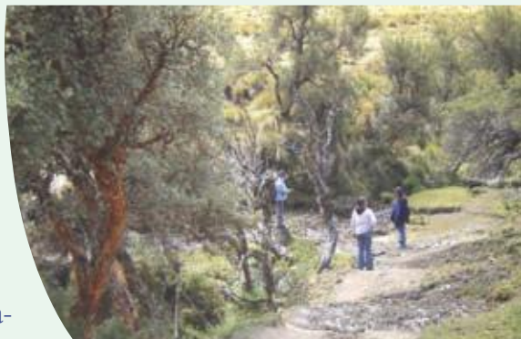
Reconocimiento de la vegetación existente en las tierras comunales de la Junta de Agua Panzaleo, cerro Rumiñahui. Se observa un bosque nativo de polylepis.

La mayor parte del trabajo se realizó con polylepis por las excelentes bondades que presenta, como adaptación a mayores alturas, rápido crecimiento, excelente protección de fuentes de agua, además por ser una planta nativa del cantón Mejía, es bien aceptada por los miembros de las juntas de agua.