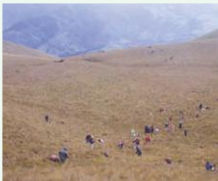
Minga de la Junta de agua El Corazón. 120 personas reforestan un área de mas de 5 hectéreas.

Las plantaciones se realizaron en minga con todos los socios y socias; los hombres jóvenes se encargan de hacer hoyos, las mujeres y niños de plantar y los ancianos y ancianas de repartir plántulas. La plantación se realizó utilizando la técnica de tres bolillo (3) , a 3 metros de distancia entre árboles, obteniéndose aproximadamente 1200 plantas por hectárea.