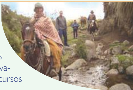
Visita que se realizó a la Junta de Agua de Chaupi durante el diagnóstico del estado de conservación de la vegetación y la protección de las vertientes de la zona.

En compañía de miembros de las juntas de agua y representantes de algunas instituciones que participaron en el proyecto, se realizaron las visitas a las fuentes de agua de 20 juntas a fin de evaluar el estado de conservación de los recursos naturales y determinar las especies forestales potenciales para reforestación. Con la ayuda de un equipo GPS se tomaron puntos de los límites de las áreas a reforestar; se analizaron las vías de acceso para el traslado de plantas, los tiempos y las distancias existentes hasta el vivero forestal que proveyó de plantas y todas las posibles dificultades que podrían existir antes y durante la fase de reforestación. Posteriormente se elaboraron mapas de las zonas con el cálculo del área propuesta (has) y el número de plantas necesarias para cubrir el área.