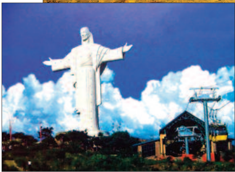
El desierto de Sud Lipez ubicado en el altiplano boliviano y el Cristo de la Concordia, en la parte más alta de Cochabamba, son sitios representativos de Bolivia.

La cónclave será del 20 al 22 de abril y se espera la asistencia de organizaciones sociales y pueblos indígenas, mayoritariamente.