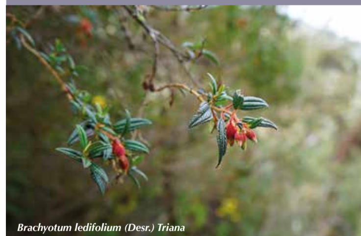
Brachyotum ledifolium (Desr.) Triana

Cada eje tiene sus objetivos, metas, líneas de acción, acciones estratégicas e indicadores, generados bajo seis componentes transversales: 1. Recursos Hídricos 2. Biodiversidad 3. Cambio climático 4. Género 5. Movilidad humana y 6. Degradación.