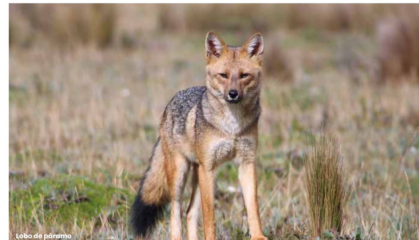
Lobo de páramo

En la Fase de Construcción el MAATE conformó un Grupo Núcleo de Redacción formado por autoridades de despacho, Subsecretarías, Coordinaciones y Direcciones y un Grupo de Apoyo a la Redacción , formado por representantes expertos de las instituciones de cooperación - CI Ecuador, Condesan, ECOPAR, FAO, FONAG, GIZ, Minga de la Montaña y USFQ, para discusión y análisis del PAN - Páramos. Se organizó un equipo coordinador de redacción y se aprobó la estructura del Plan.