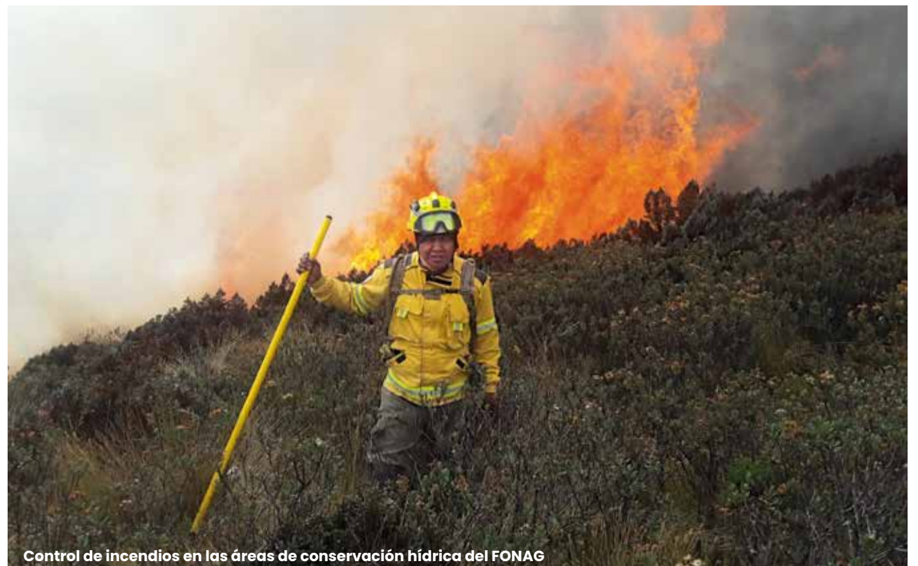
Control de incendios en las áreas de conservación hídrica del FONAG