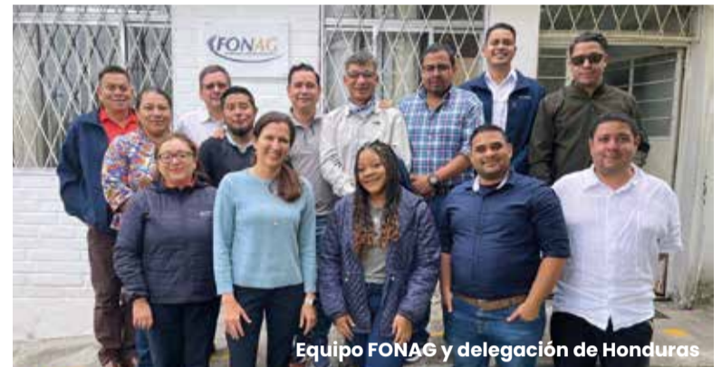
Equipo FONAG y delegación de Honduras

El impacto del FONAG también se extiende a la creación de fondos de agua en otras regiones. Una comisión desde Honduras, acompañados del Banco Interamericano de Desarrollo (BID), interesados en la temática de Seguridad Hídrica, visitaron FONAG para conocer de cerca las acciones emprendidas en favor de la conservación de fuentes de agua,