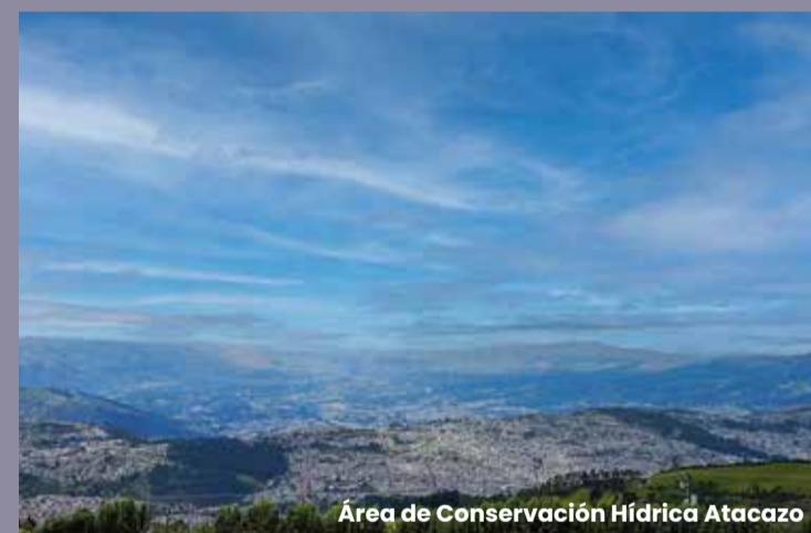
Área de Conservación Hídrica Atacazo

cuperación y gestión sostenible de estos importantes ecosistemas, partiendo del intercambio de conocimientos y experiencias sobre los problemas y necesidades sociales, económicos y ambientales, logrando una mejor comprensión y análisis sobre su realidad actual e identificando posibles soluciones, propuestas y oportunidades.